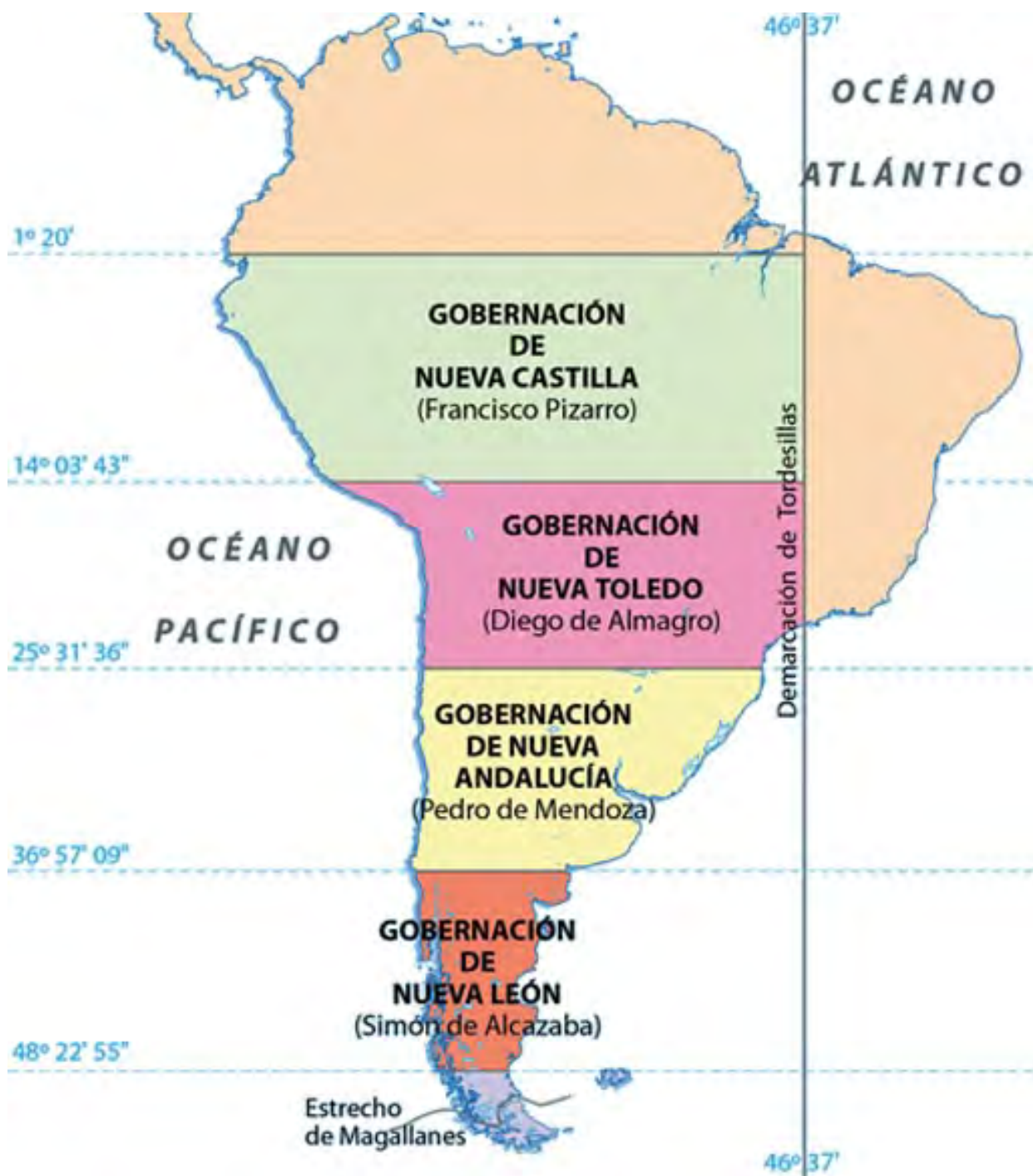
Mapa de las capitulaciones de Toledo 8 , 26 de julio de 1529 y 21 de mayo de 1534.